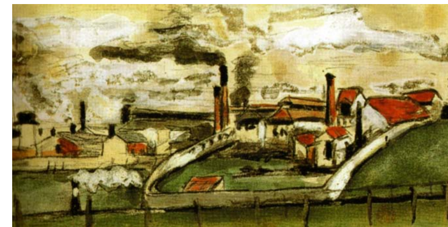
Usines à l'Estaque, Paul Cézanne, 1869, Musée Granet, Aix-en-Provence